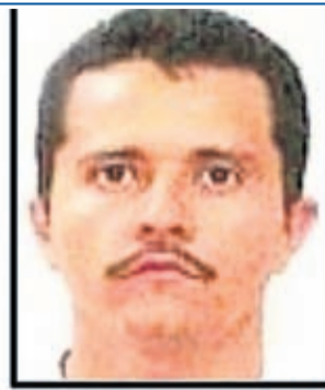
Nemesio OSEGUERA CERVANTES (a.k.a. OSEGUERA CERVANTES, Ruben)

CIUDAD DI MEXICO (Infobae) – Gobierno di Merca y Mexico lo a cera un pacto pa creacion di un unidad di inteligencia y operacion pa captura e narcotraficante mas importante y peligroso di mundo: Nemesio Oseguera Cervantes, lider di e Cartel Jalisco Nueva Generacion (CJNG).